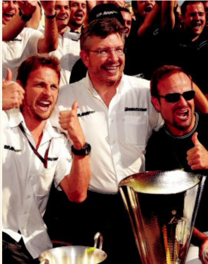
Ross Brawn, rodeado de sus pilotos en un año exultante

El efecto Brawn ha conmovido no sólo la Fórmula 1 sino también el mundo del deporte y ha mostrado una nueva forma de hacer las cosas y ha inspirado futuras políticas. "Lecciones de Brawn GP: 10 claves empresariales para competir con éxito" es, precisamente, el título de un libro escrito por Antoni Gutiérrez-Rubí