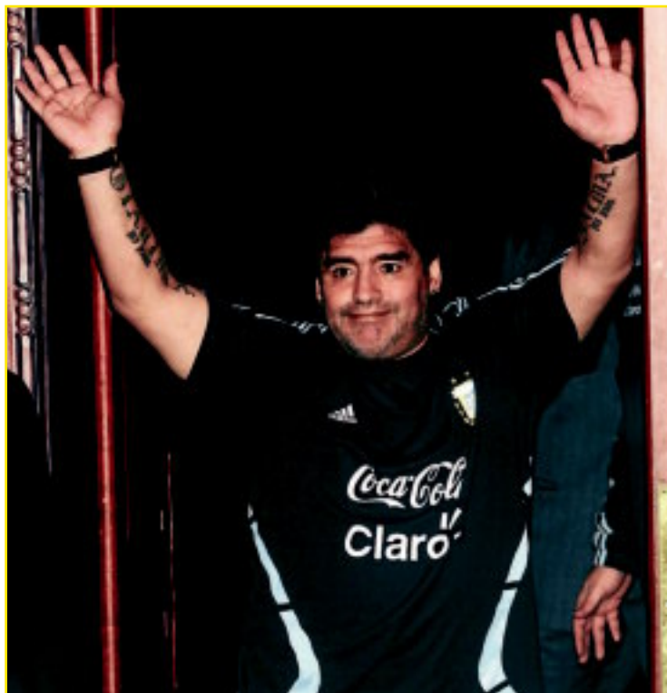
Maradona podría desembarcar en la Premier League

Con una disponibilidad ilimitada de fondos y libertad absoluta para decidir, Maradona estaría encantado de trabajar en Inglaterra. Faltaría, claro, que se desligase de su cometido al frente de la selección argentina aunque, tratándose de quien se trata, no parece que tuviera demasiadas dificultades en abandonar el banquillo albiceleste para iniciar una aventura, cuanto menos, apasionante. ■