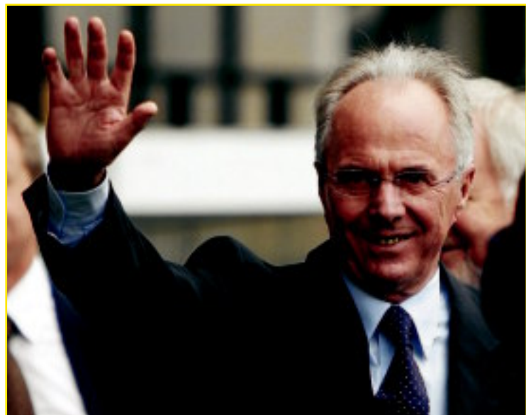
Eriksson es el nuevo director deportivo del club más antiguo del mundo